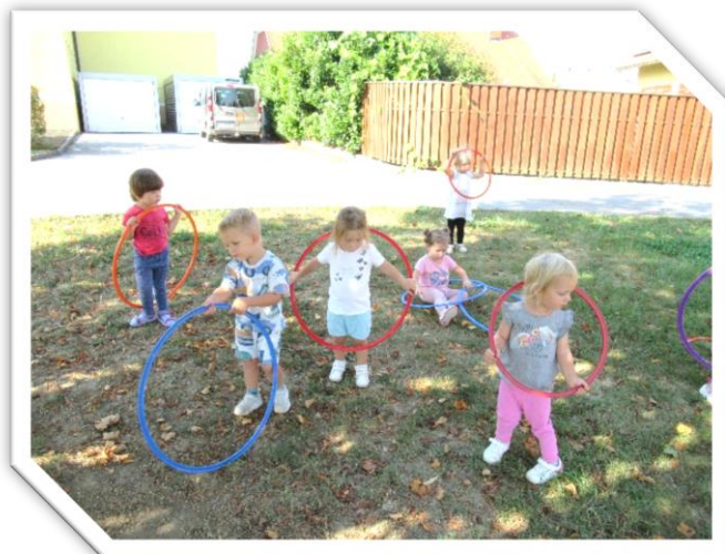
Otroci iz skupine Sončki

Če otrok ne bo več obiskoval vrtca, ga je potrebno odjaviti najkasneje do 20. v mesecu za naslednji teden, in sicer z izjavo o izpisu, ki jo lahko dobite v vrtcu ali na spletni strani vrtca.