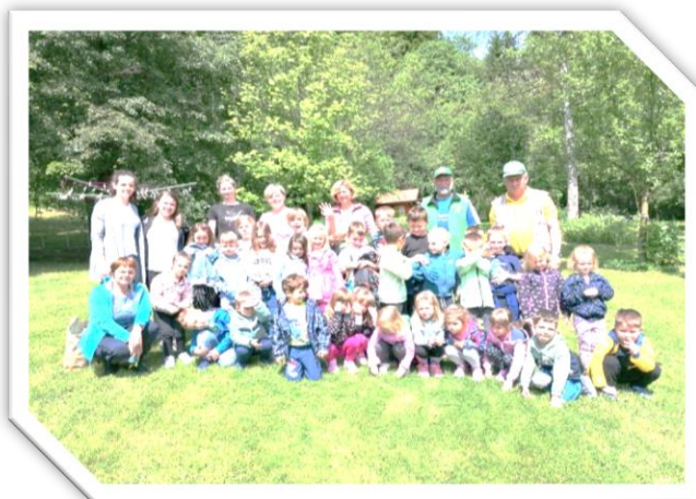
Skupini Sovice in Metuljčki sta obiskali čebelarja ter si ogledali čebeljak